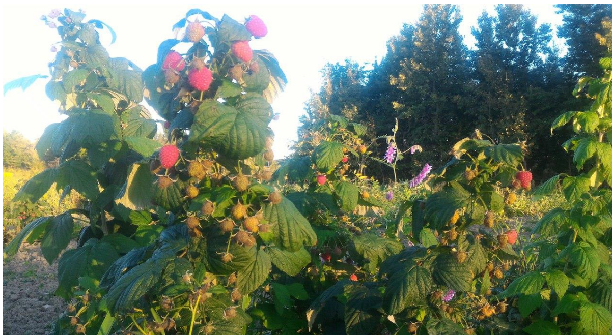
Фото из ягодника п. Молочное